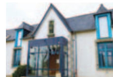
Club Jeanne d'Arc

Mardi 7 juillet marche au départ du pont de Kerrous. Départ 9h30 en groupe de 10 personnes.