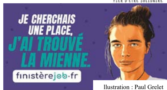
Illustration : Paul Grelet

Le Conseil départemental a également souhaité mettre en avant l'alternance pour les jeunes. Une rubrique y est dédiée et recense ces offres : le partenariat mis en place avec la Chambre de commerce et d'industrie de Bretagne permet le lien vers le site de Bretagne alternance, qui recense les offres sur la Bretagne.