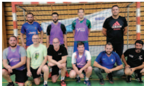
▲ ▲ Les séniors gars et les séniors filles lors de la reprise des entraînements.